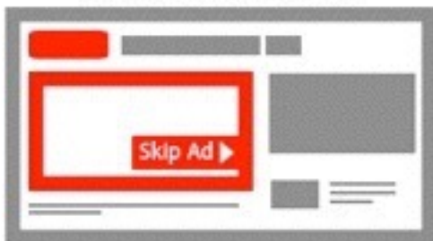
TrueView in-stream ads